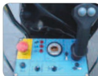
Robustní, jednoduchý a intuitivní ovládací panel umístěný v koši