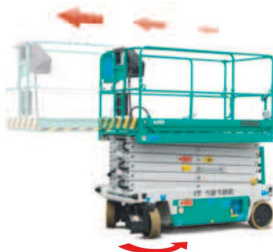
Manuální výsuv koše o 1,4 m