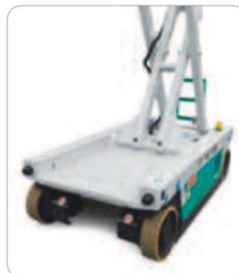
Účelné provedení podvozku usnadňuje čištění