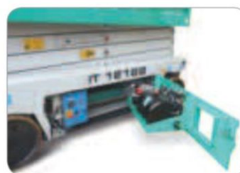
Všechny komponenty jsou snadno přístupné pro provádění údržby